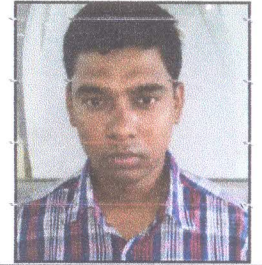
রাসেল ইলেকট্রিক ইনচার্জ সদস্য সচিব