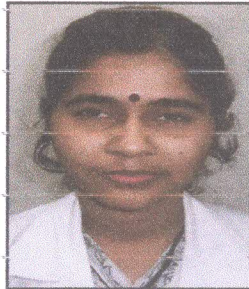
সাথী ভাবুক মেডিকেল সহকারী সদস্য