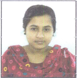
বীথি ফোল্ডিং লেডি সদস্য